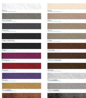
Para pedir todos los colores de la carta CMR. * Colores CMR y base satinado con textura porosa.