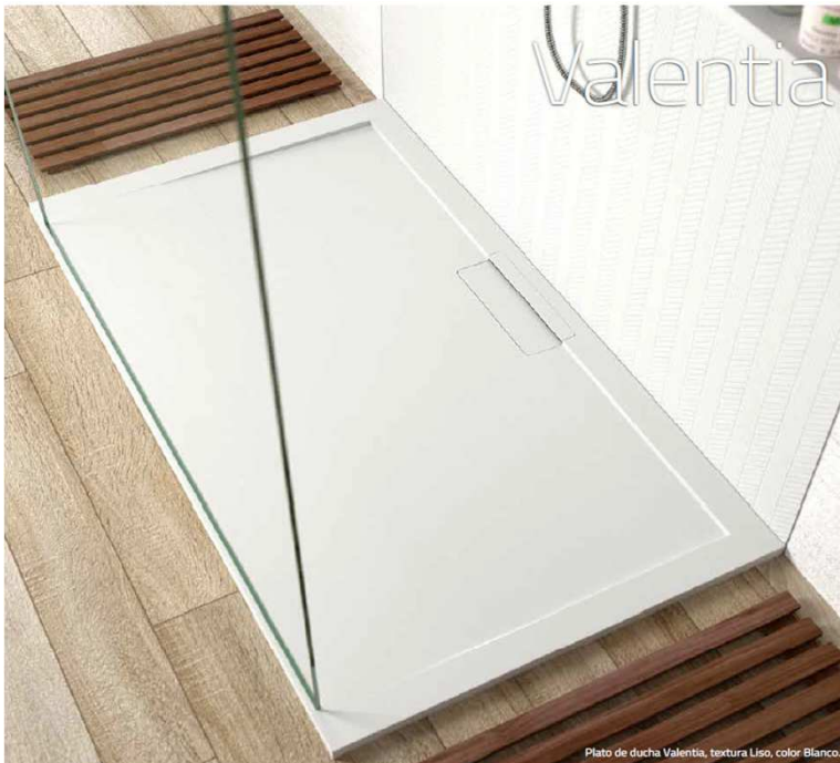
Plato de ducha Valentia, textura Liso, color Blanco.

Plato fabricado con resina de poliéster y cargas minerales de cuarzo.